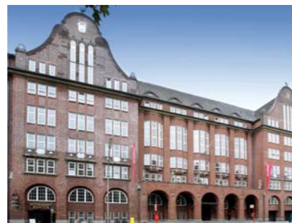
Handwerkskammer Hamburg als Tagungsort

Veranstaltungsort ist diesmal die Handwerkskammer Hamburg, Holstenwall 12, 20355 Hamburg (nicht mehr die Handelskammer!). Die Veranstaltungstätte befindet sich in der Hamburger Innenstadt und ist von vielen Hotels aus fußläufig erreichbar.