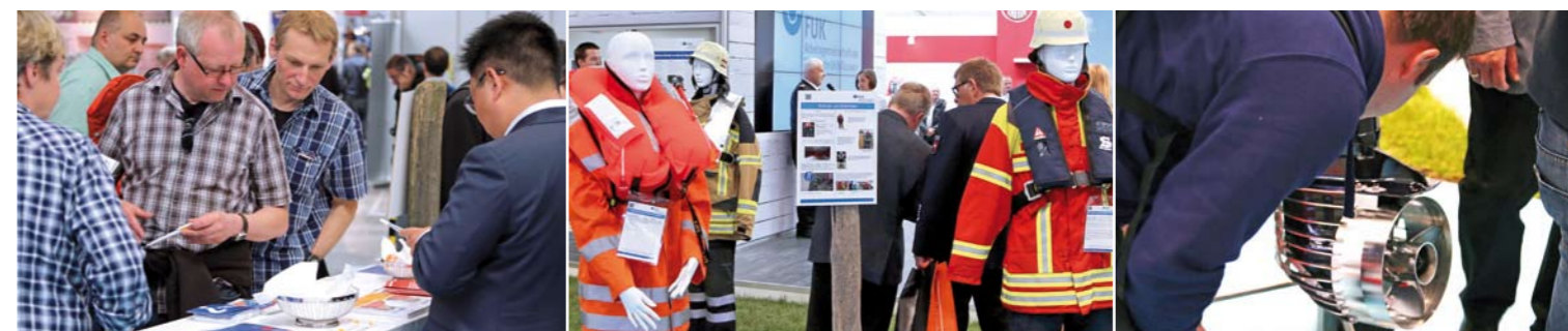
Keine Uniform – dennoch interessiert