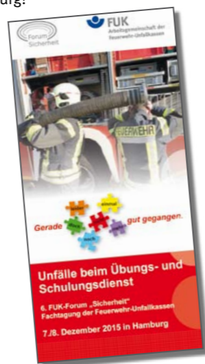
Der Flyer steht als Download auf der Seite www.hfuk-nord.de zur Verfügung