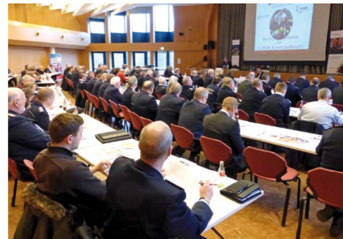
Rund 180 Führungskräfte der Städte, Gemeinden und Feuerwehren besuchten das 4. HFUK-Kommunalforum.

Die Hanseatische Feuerwehr-Unfallkasse Nord hatte zu ihrem 4. Kommunalforum eingeladen: Rund 180 Mitarbeiter der Städte und Gemeinden sowie Führungskräfte der Feuerwehren besuchten die Fachtagung, um gemeinsam wichtige Themen zur sozialen Absicherung und zur Prävention von Unfällen in der Freiwilligen Feuerwehr zu diskutieren. Unter dem Leitmotiv „FEUERWEHR: Ehrenamt braucht Sicherheit“ war das Themenfeld breit abgesteckt.