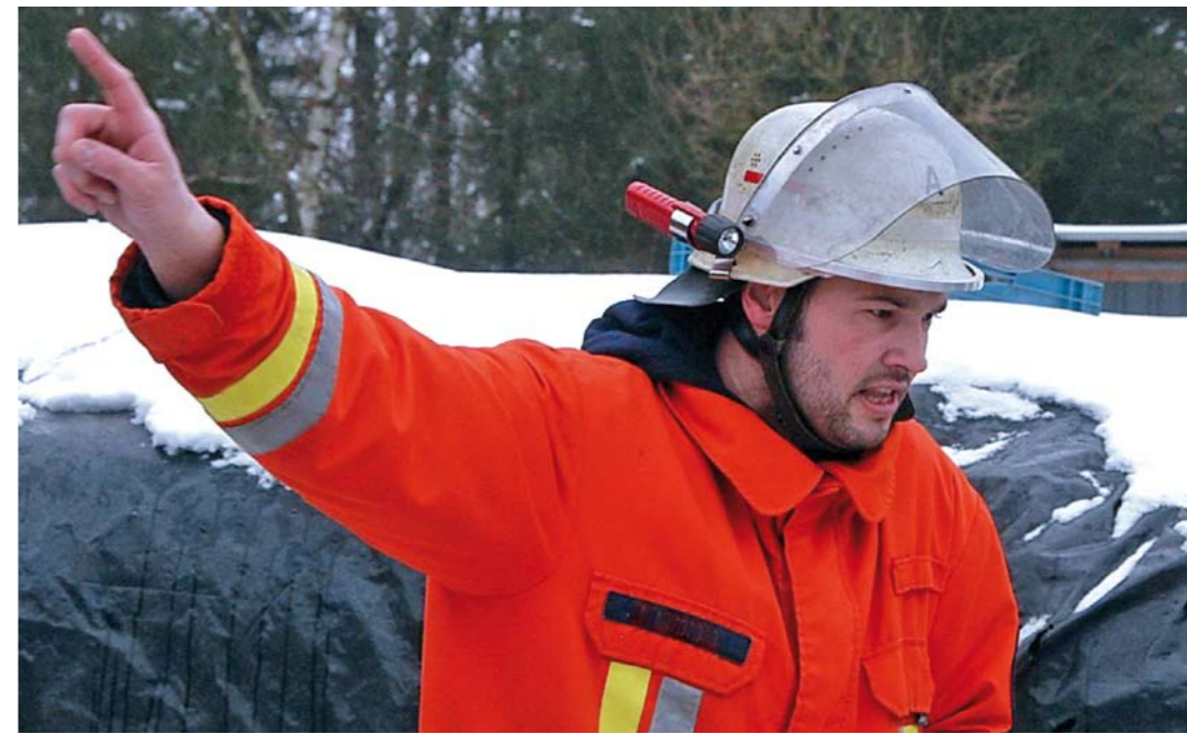
Klare Ansagen sind gefragt.

Generell werden die Leistungen aus der gesetzlichen Unfallversicherung von Amts wegen erbracht (§ 19 SGB IV). Allerdings muss die Feuerwehr-Unfallkasse erst einmal Informationen über einen Arbeitsunfall bekommen, bevor Leistungen erbracht werden können. Hier kommt die Gemeinde als Träger der Feuerwehr (versicherungsrechtlicher Unternehmer) ins Spiel. Denn der Unternehmer ist gemäß § 193 SGB VII verpflichtet, Unfälle von Feuerwehrangehörigen bei der Feuerwehr-Unfallkasse innerhalb von drei Tagen nach Kenntnis anzuzeigen. Nicht zuletzt aus diesem Grunde ist die „Unfallanzeige“ heiß begehrt. Gibt man diesen Suchbegriff im Internet ein, erhält man über 62.000 Treffer. Jeder Unfallversicherungsträger bietet das Formular zum Download an.