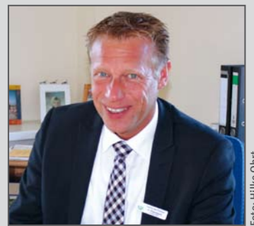
Olaf Plambeck, Bürgermeister der Gemeinde Flintbek