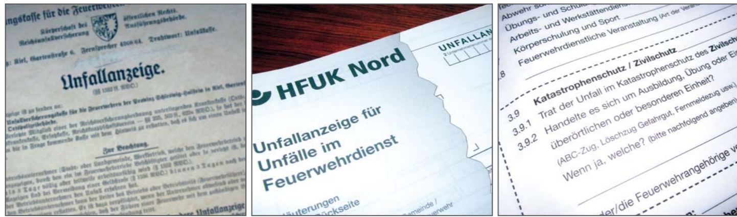
Was die alles wissen wollen! Jetzt auch noch Fragen zum Katastrophenschutz?