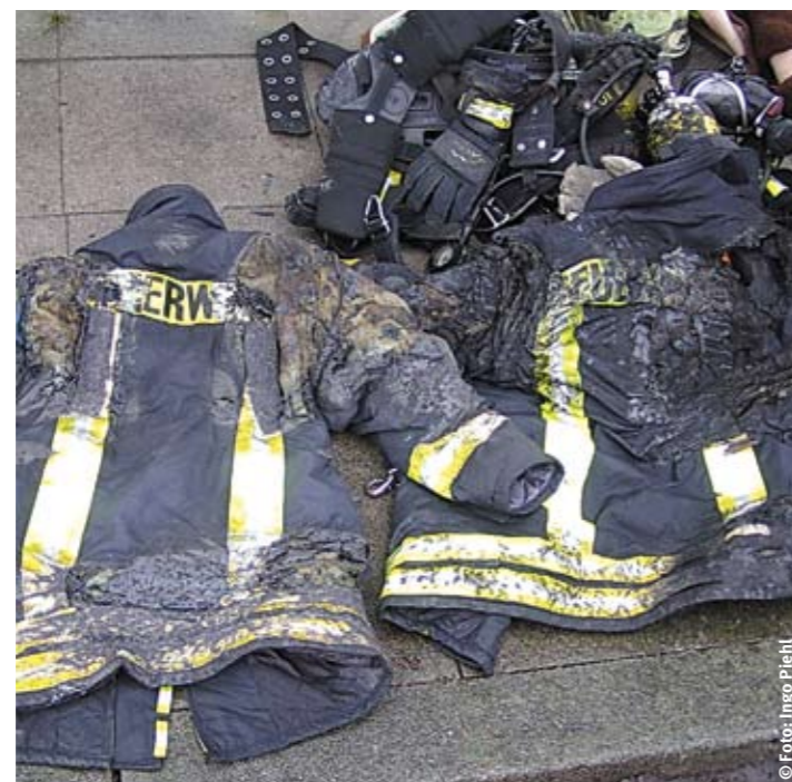
Die vom Brand zerstörten Feuerwehr-Überjacken hielten die Stichflammen ab.

Bäcker und der Deutsche Feuerwehrverband unterstützen mit dem eigens gebackenen Florians Brot die örtlichen Jugendfeuerwehren. Bei der von Meister Marken – Ulmer Spatz getragenen Aktion gehen von jedem verkauften Florians Brot 20 bis 40 Cent an die Jugendfeuerwehr.