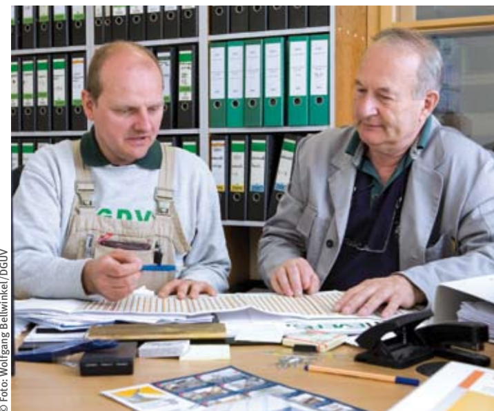
Eingliederungsmanagement hilft dabei, nach langer Krankheit die Rückkehr an den Arbeitsplatz zu erleichtern.

Mit DGUV job haben Berufsgenossenschaften und Unfallkassen einen internetgestützten Service für Personal- und Arbeitsvermittlung ins Leben gerufen. Nach einem Pilotprojekt in zwei Landesverbänden wurde der Service von allen Landesverbänden der DGUV übernommen.