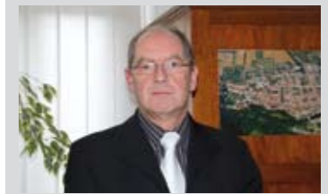
Joachim Günzel, Bürgermeister der Stadt Stadtilm